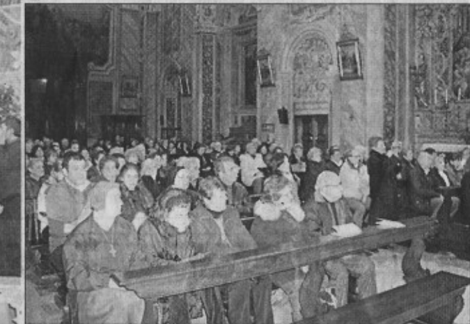
■ Il coro «Il rifugio» e il pubblico della trasferta in Franciacorta

progetti dei quattro missionari di Ome impegnati da anni in Brasile, Honduras, Mozambico e Perù ha dichiarato il por-